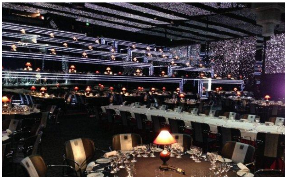
20:30 Diner de Gala dans le Salon Noir et Argent du Casino d' Estoril