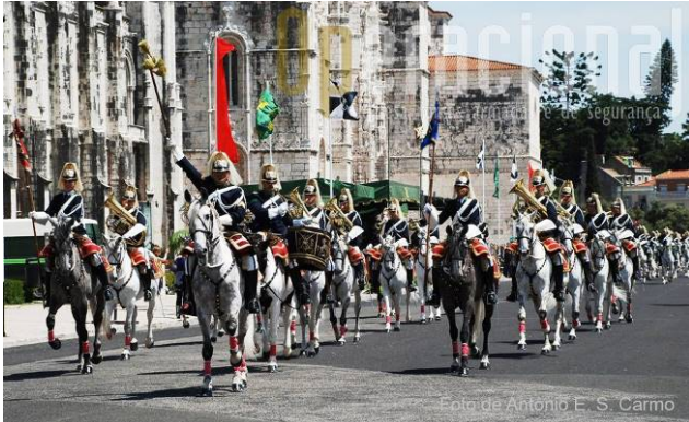
Défilé des Confréries avec la fanfare de la GNR