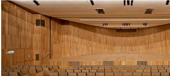
Auditorium del Congreso