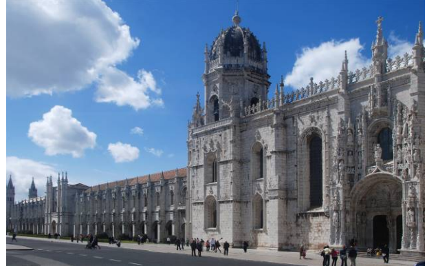
Messe en l'Eglise du monastère de los Jerónimos