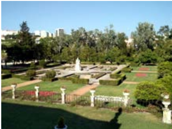
Déjeuner dans les Jardins do Palácio do Marquês de Pombal