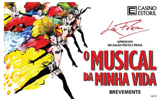
22:30 Spettacolo nel Casinò di Estoril “El musical de mi vida”