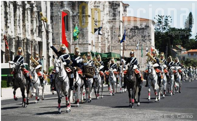
Sfilata delle Confraternite con charanga della GNR Jerónimos