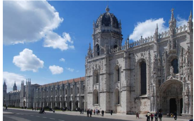
Missa na Igreja do Mosteiro dos Jerónimos