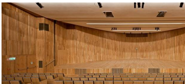
Auditório do Congresso