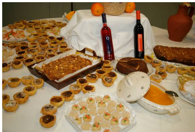
Mostra Enogastronómica das Confrarias CEUCO