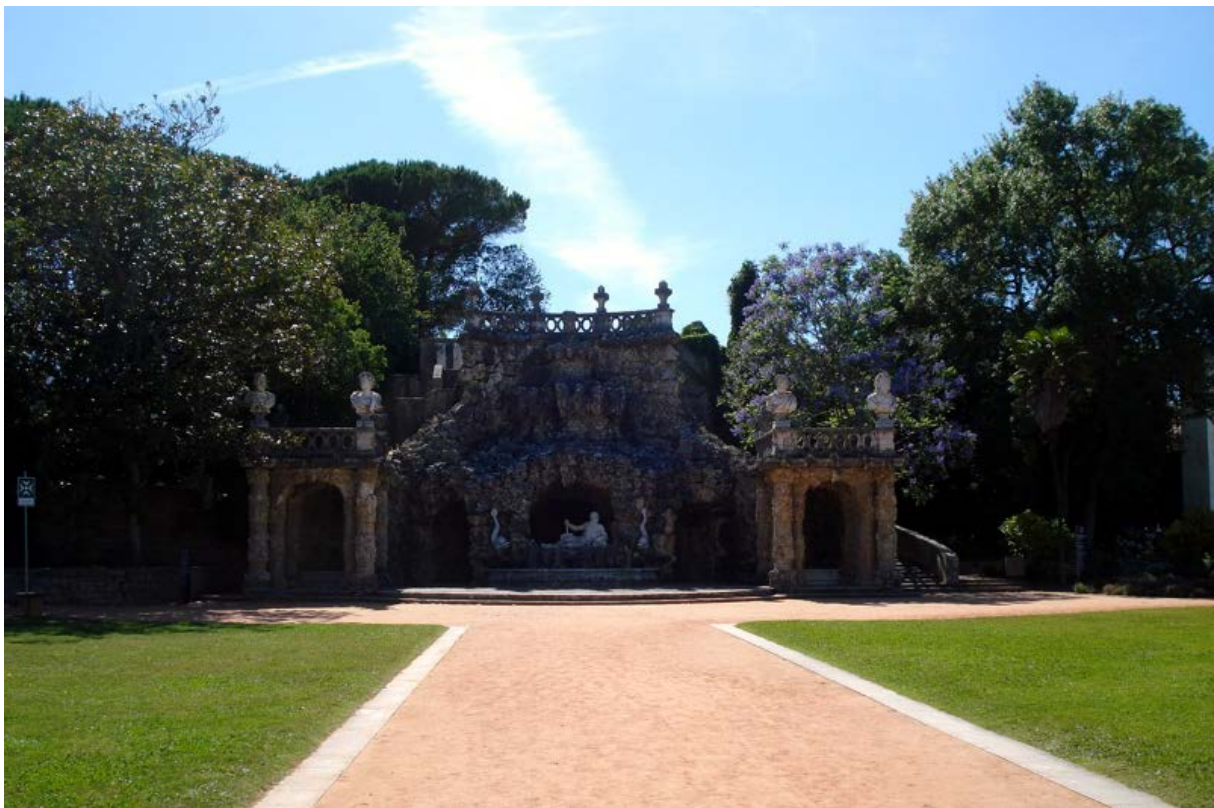
Jardins do Palácio do Marquês de Pombal