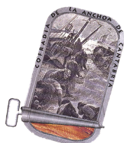
COFRADÍA DE LA ANCHOA DE CANTABRIA