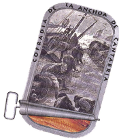
COFRADÍA DE LA ANCHOA DE CANTABRIA